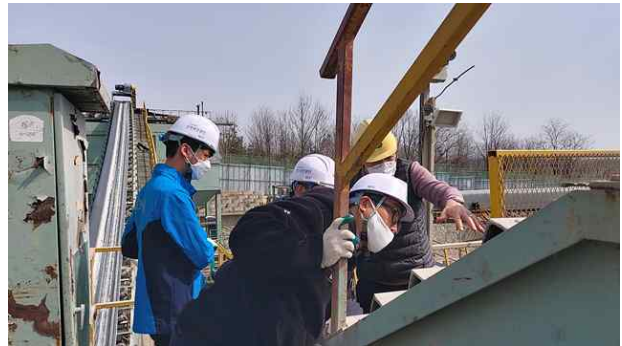
〈협회-공단 현장조사 전경〉

또한 지난 3월 24일 개최된 고용노동부-환경부-공단과의 관계기관 업무협약에서 협회는 5월 실시예정인 중간처리 사업장에 대한 현장점검 시 계도중심의 점검을 요구하고, 중간처리업체에서 자체 점검이 이루어질 수 있도록 기술지도자료 제공을 요청하였습니다.